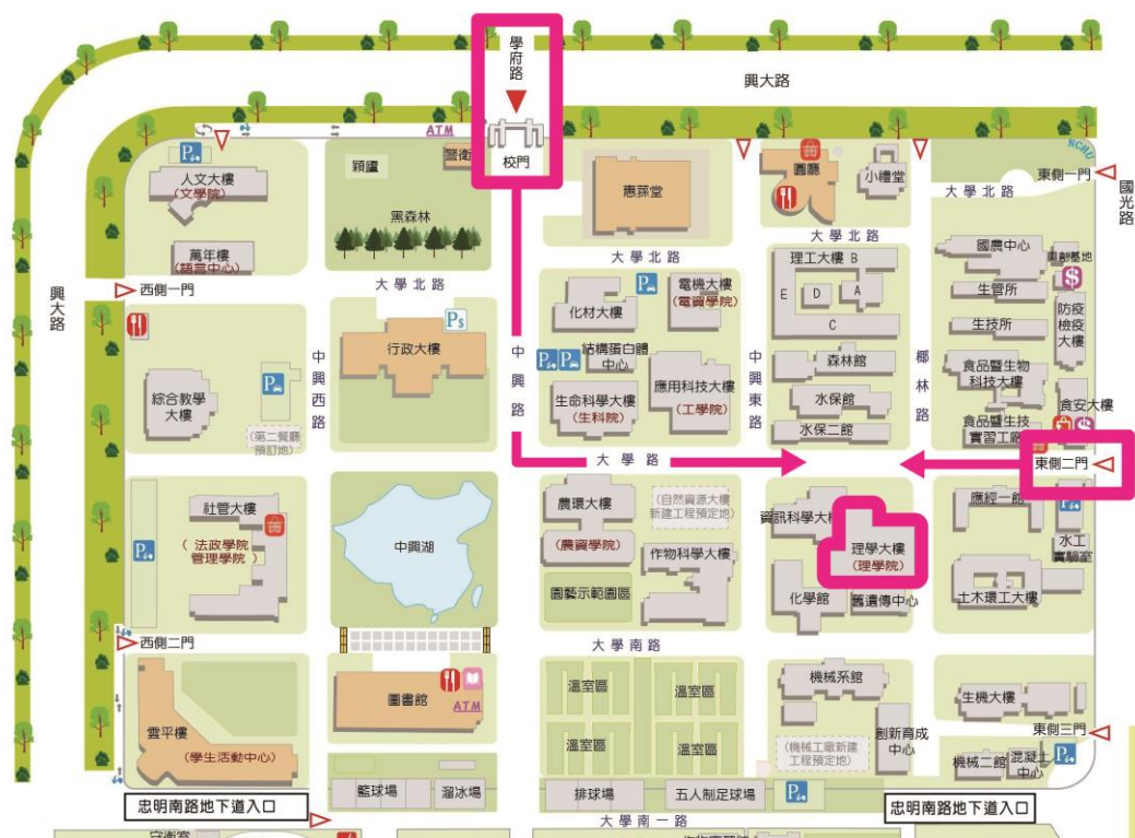
▲中興大學校園平面配置圖