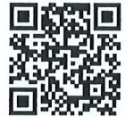
教案教學活動表單

(1) 以google表單或email方式報名：表單連結 https://reurl.cc/p3NGKQ ，報名表如附件 3。